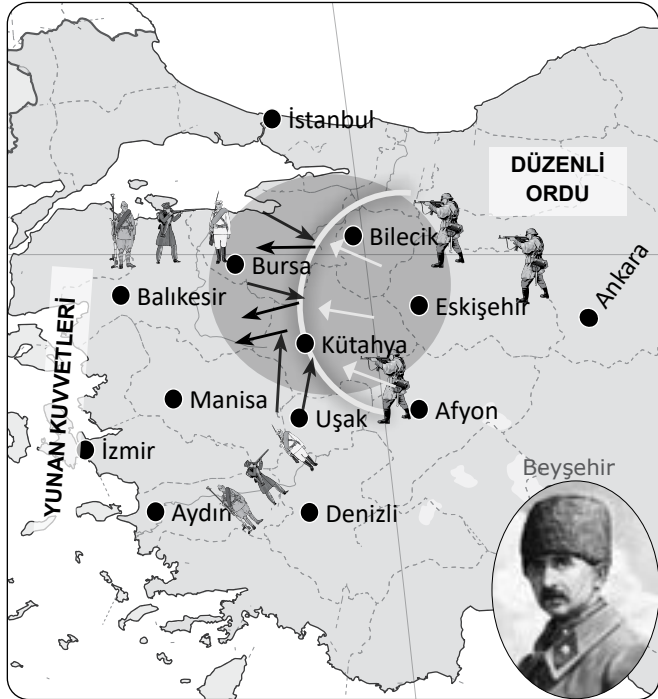
I. İnönü Savaşı Haritası ve İsmet İnönü